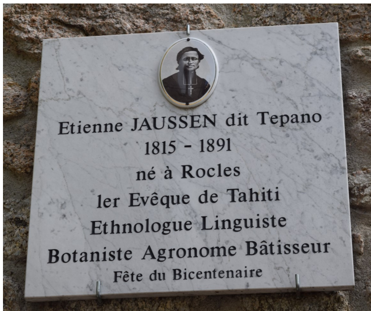
Et la plaque qui est sur la façade avant de ladite église

Il fait ses études à Mende et obtient son diplôme d'instituteur, puis le baccalauréat de lettres à Montpellier. Ensuite il entre au grand séminaire de Périgueux. Il est ordonné prêtre en 1840. Il entre dans la congrégation des Sacré-Cœurs de Jésus et Marie dont les membres, couramment appelés les picpuciens sont voués à l'apostolat missionnaire et à la formation des séminaristes. Au noviciat de la congrégation, à Vaugirard il rejoint plusieurs membres de sa famille ; des oncles, son frère aîné, ses tantes et deux de ses sœurs