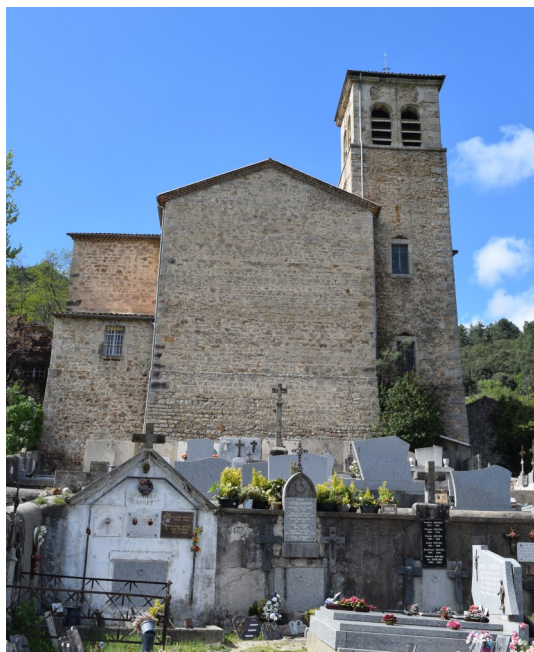
Eglise de Rocles, vue depuis de cimetière.

Etienne Florentin JAUSSEN naît en Ardèche à Rocles, au hameau des Perriers le 2 avril 1815. Ses ancêtres connus sont tous d'Ardèche à partir de 1570.