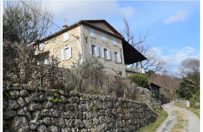
Une maison du lieu de Laubezon. Pourrait être la maison natale